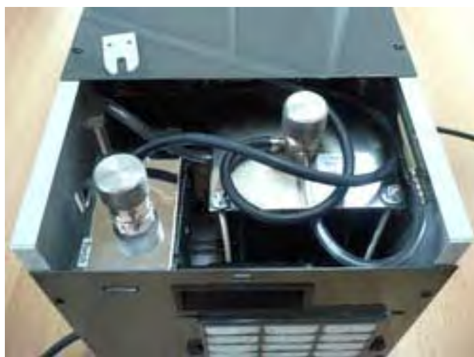
Lucidatrice Microflame Professional 30