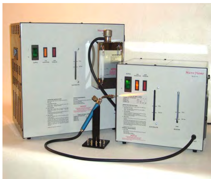
Lucidatrice Microflame Professional 30 + Lucidatrice Microflame Professional 60