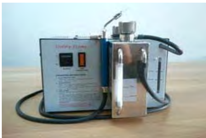
Lucidatrice Microflame Mini

2 Kit di 6 ugelli varie misure – Imbuto – Tubo di collegamento.