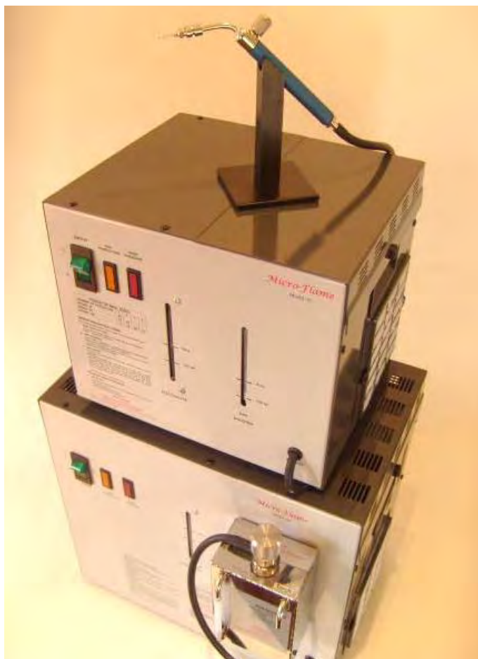
Lucidatrice Microflame Professional 120 + Lucidatrice Microflame Professional 60

2 Kit di 6 ugelli varie misure – Imbuto – Tubo di collegamento.